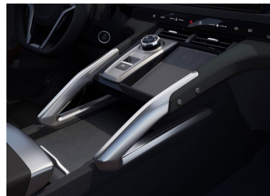
Ricarica induttiva, sistema Start-Stop e climatizzatore automatico