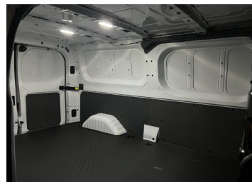
Rivestimento del vano di carico a mezza altezza con punti di fissaggio per un carico sicuro e 2 LED