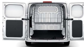
Ampio vano di carico con rivestimento resistente