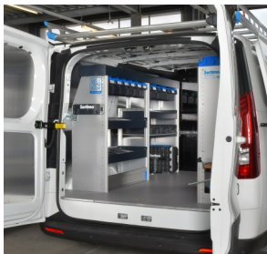
Piastra di base Sobogrip (antiscivolo)

Tutte le soluzioni Sortimo sono personalizzabili e specificamente progettate per eDeliver 3, eDeliver 5 ed eDeliver 7.