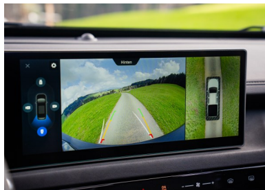
Telecamera a 360° e sensori di parcheggio anteriori e posteriori

Animale da lavoro? Avventura? Tutto in uno.