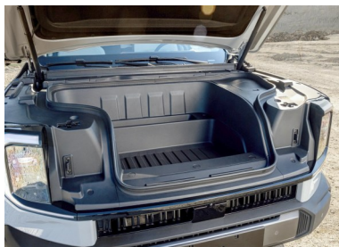
236 litri di spazio nel bagagliaio anteriore per attrezzi, cavi di ricarica e altro, combinato con la funzione V2L