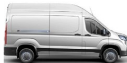
VAN & DCV L3 H2&H3