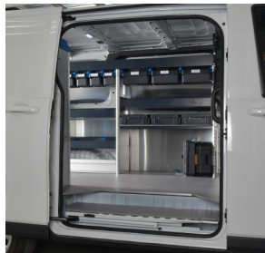
SR BOXX per conservare in modo ordinato piccoli oggetti