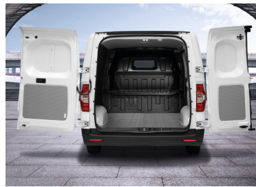
Porte posteriori ad ala con angolo di apertura di 180° e sensori di parcheggio nel paraurti posteriore