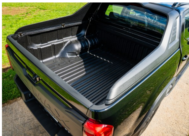
Pianale verniciato con ampio spazio per attrezzi, macchinari e materiali