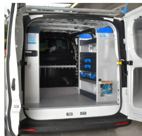
Banco da lavoro con morsa integrata