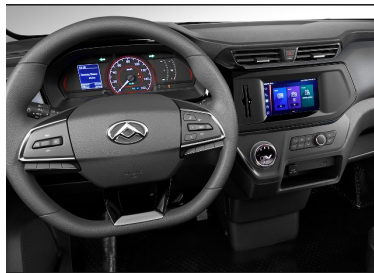
Cabina di guida con touchscreen da 10,25" e volante multifunzione – incl. Apple CarPlay e Android Auto