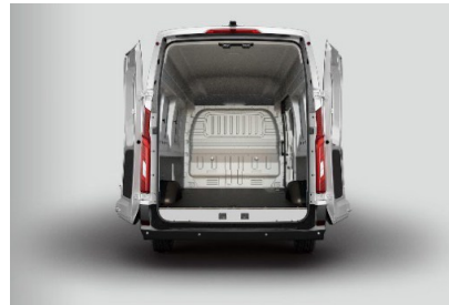
Apertura della porta: fino a 180° (L2) / 256° (L3) – massima accessibilità durante il carico