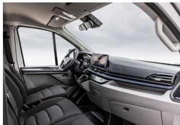
Ricco di soluzioni intelligenti per il comfort e la sicurezza

L'eDeliver 7 non è solo unico nel suo genere: È pronto all'uso per qualsiasi sfida.