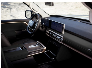
Con climatizzatore automatico, sedili riscaldati, sedili in pelle e volante multifunzione