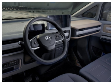
Cabina spaziosa con touchscreen da 12,3" e connettività all'avanguardia