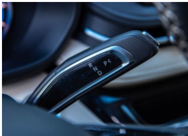
Leva del cambio a portata di mano: poco ingombrante e intuitiva da usare

eDelivery 9: la soluzione potente per impieghi intensivi.