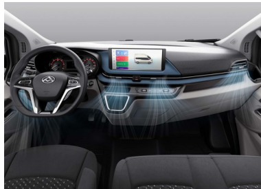
Cabina di guida con climatizzatore automatico e touchscreen da 12,3 pollici con Apple CarPlay e Android Auto inclusi