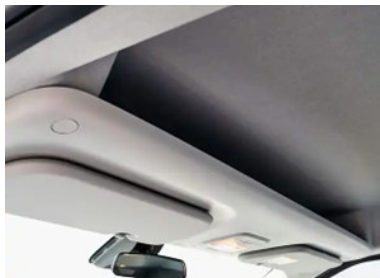
Portapacchi sul tetto per un accesso rapido

Il caratteristico design retrò, tre modalità di guida e la ricarica rapida CC (80% in 36 minuti) sottolineano che qui la mobilità elettrica viene implementata in modo semplicemente convincente.