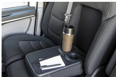
Schienale centrale ribaltabile con vano portaoggetti integrato, portabicchieri e poggiatesta