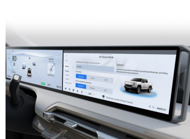
Sistema di telecamere a 360°, sensori di parcheggio anteriori e posteriori, doppio display da 12,3" e ricarica wireless per smartphone: connesso, intuitivo e confortevole

*a seconda del pacchetto di equipaggiamento